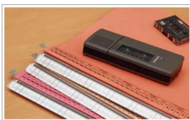
Papierakten in der Kanzlei Rudnicki

Das Führen einer Handakte gehört zu den täglichen Aufgaben in jeder Kanzlei. Sobald ein Rechtsanwalt von einem Mandanten beauftragt worden ist, ihn in Rechtsangelegenheiten zu vertreten, wird in der Kanzlei eine neue Akte angelegt - die sogenannte Handakte.